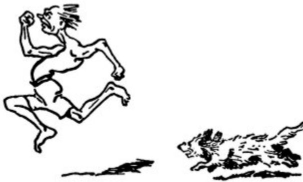
Seguridad ante todo

“Enseño a mis hombres a seguir adelante sin importar las balas, con el espíritu de victoria, mientras que a su ejército en Inglaterra le enseñan a cubrirse para evitar bajas. En una palabra ustedes les enseñan a tener miedo a los proyectiles antes de llegar a la línea de fuego. Si inculcan miedo físico, puede desarrollarse el miedo moral”.