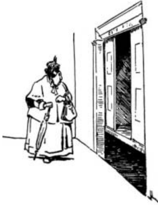
La que duda, pierde

Hay sin embargo, algunos tropiezos morales que pueden presentarse al joven que emprende el camino de la vida, y debe prevenírsele por los viejos que ya pasaron por ahí.