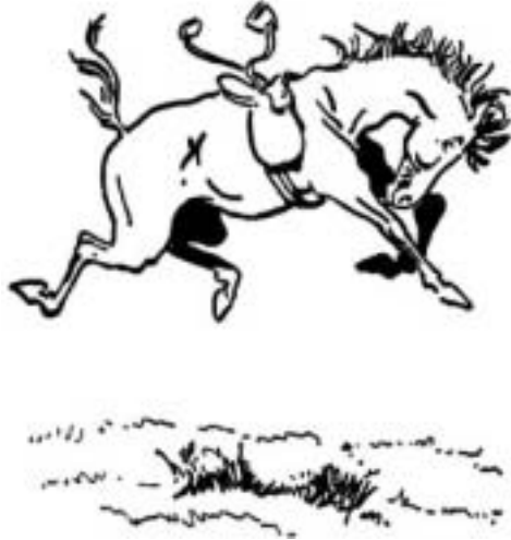
El espíritu del lunes por la mañana

El caballo nos enseña lo que el espíritu del "lunes en la mañana" debe ser.