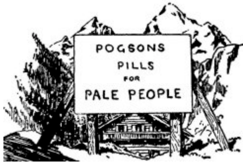
Apreciación de la belleza

"Donde hubo invierno, es ahora primavera"