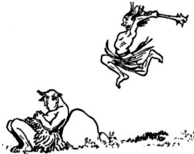
Viejo remedio para los que no hacen nada

Era una ocasión momentánea e impresionante en un punto de retomar su vida, la cual, como regla, influenciaba su carácter y su conducta posterior.