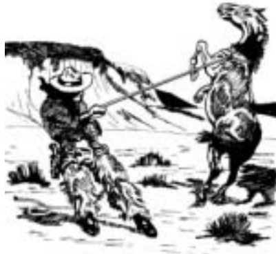
Dibujo de la portada original del libro.

3 Se refiere a la portada original del libro, de la que se presenta el dibujo.