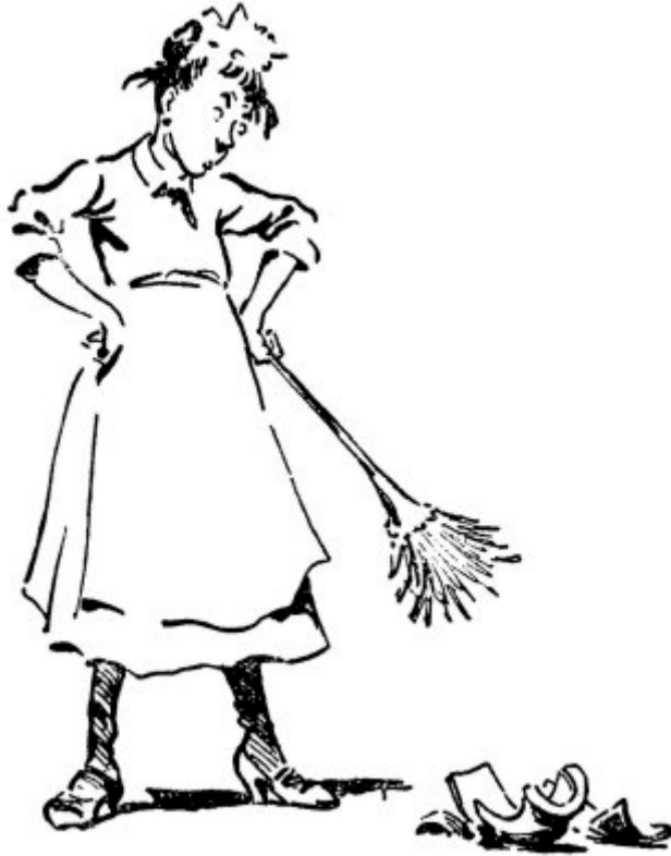
Cambio y destrucción en todo lo que veo

Por otro lado, el hábito de fumar es cómodo al fumador pero una molestia para otros, frecuentemente vulgar y él es el último en enterarse. Aún así, a diario puedes ver hombres que llenan un vagón de no fumadores con humo que se quedará ahí enfermado a las damas y a los que viajen después.